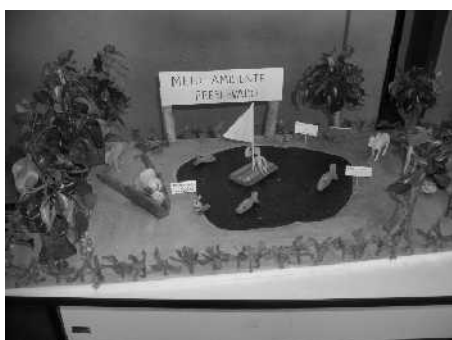
(Maquete do 4º ano ambiente tratado)