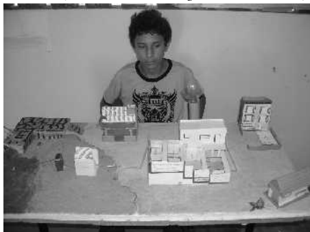
(Maquete do 5º ano A Tratamento de esgoto)