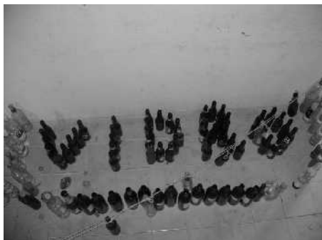
Vidro (acima) e latas (abaixo)