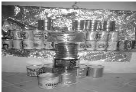
(trabalhos sobre reciclagem dos 6º anos A e B)